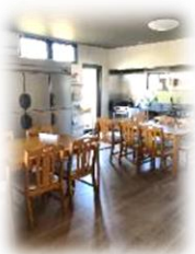
新築した外国人寮