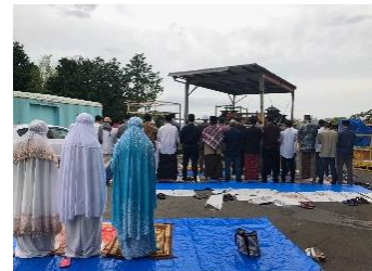
ラマダーン明けのお祈り