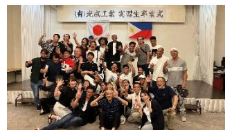
日本人従業員と外国人 従業員の集合写真