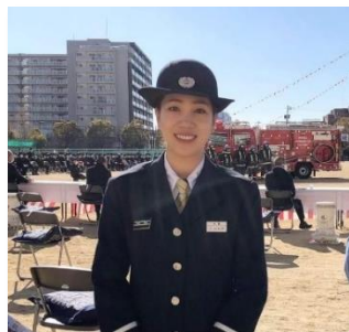
消防団の活動の様子