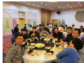
毎年恒例の社内懇親会の様子