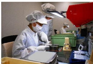
特定技能の先輩が新たに入社した技能実習生に指導する様子