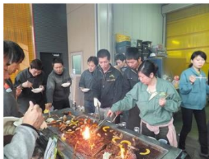
会社主催のバーベキュー