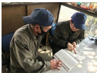
日本語学習の様子