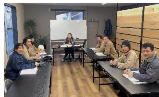
日本語の授業の様子