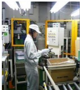
加工検査工程(付随作業)