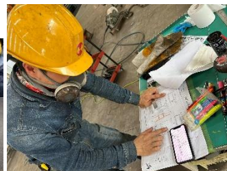
作業風景(図面読み取り中)