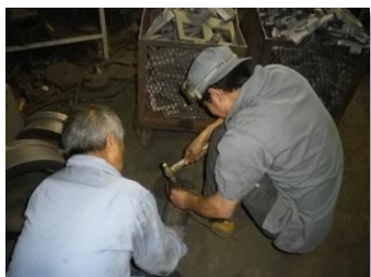
作業を教える様子