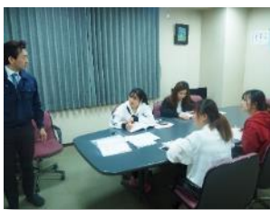
社内での日本語勉強会