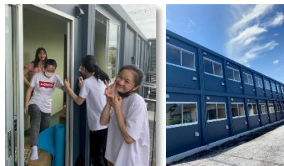
新築の寮・引っ越しの様子