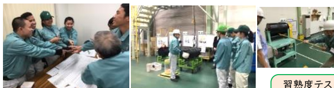
社内のKY（危険予知）教育 安全体感技塾での体感教育