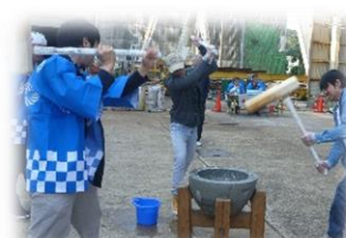
家族会でのもちつき