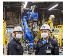
技能実習生に指導する特定技能外国人材