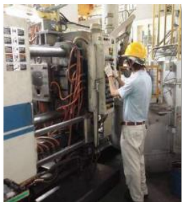
鑄造工程(メイン業務)