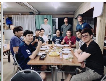
寮での親睦パーティ