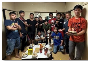
特定技能社員による技能実習生の歓迎会兼懇親会