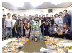
寮生主催の実習生歓迎会