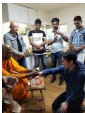
スリランカのお正月