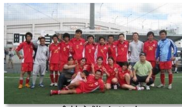
会社主催イベント