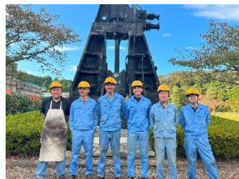
従業員の集合写真