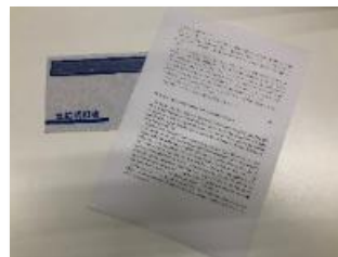
メッセージ付の給与明細