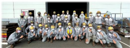
従業員の集合写真