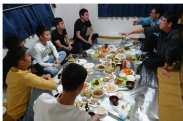
社内交流・懇親の様子