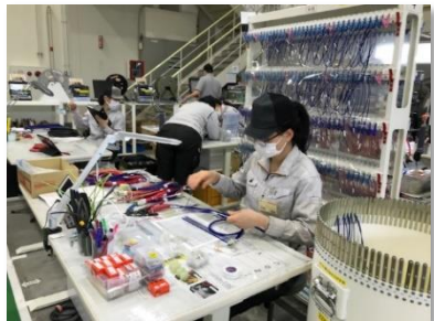
特定技能者作業風景