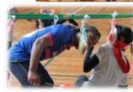
運動会(ミノリンピック)、地域の夏祭りへの参加