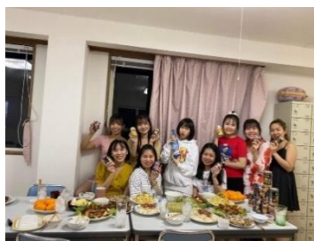
寮での親睦会風景