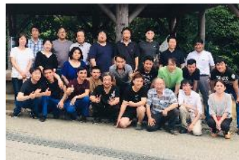
社内懇親会（バーベキュー）