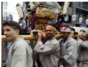
熊野神社の祭りで神輿を堪能