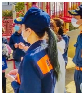
防災訓練の活動の様子