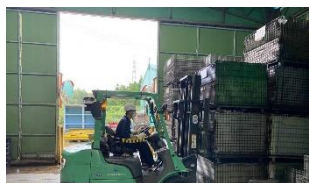
フォークリフト運転の様子