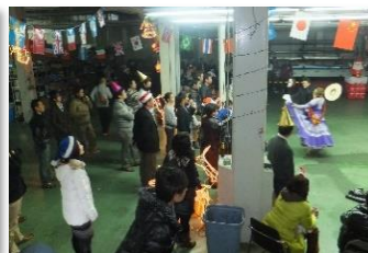
社内クリスマスパーティ