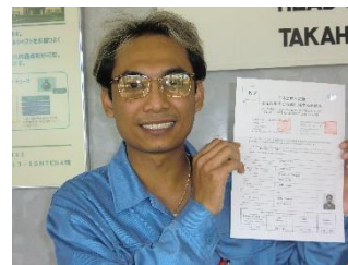
日本語能力試験N2に合格