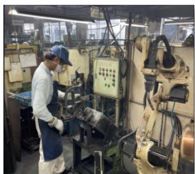
半自動溶接の様子