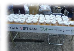
フォー（麺料理）のふるまい