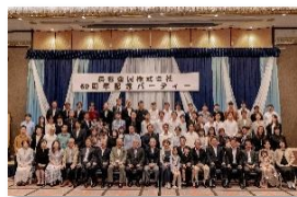
60周年記念パーティー