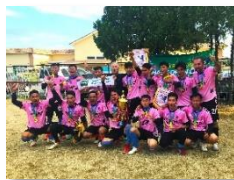
サッカー大会に参加