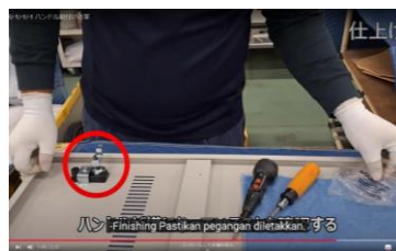
母国語での業務工程説明動画