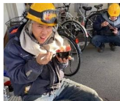
鏡開きをし、ぜんざいを食べている様子