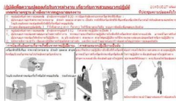
タイ語作業要領書