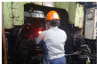
特定技能の鍛造プレス作業