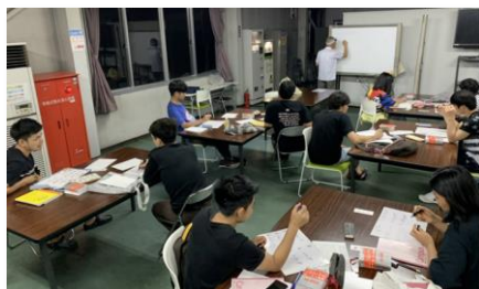
日本語教室の様子