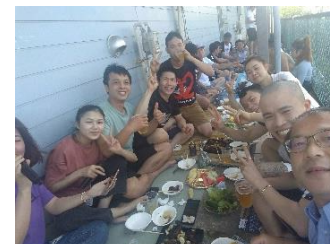
ベトナム風青空パーティー