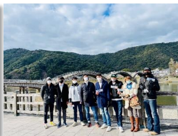
隣県名勝「錦帯橋」へ 日帰り観光旅行