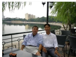
外国人材の故郷で話す様子