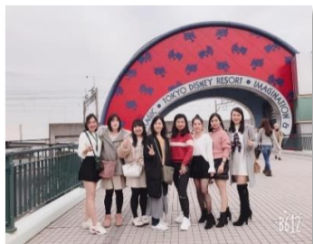
会社主催イベント