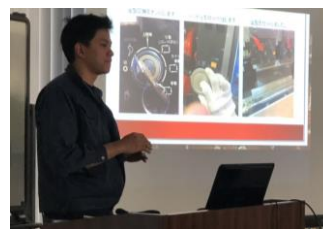
技能習得プレゼン