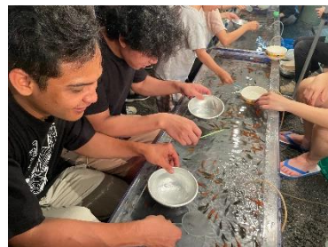
地域のお祭りに参加