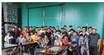
技能実習生と特定技能人材合同で行ったBBQ大会(2019年にタイの水かけ祭りに合わせて実施)