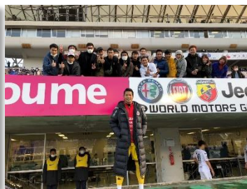
母国サッカー選手の活躍を 日本で観戦