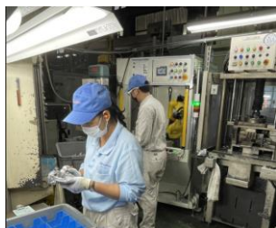
ダイカストの様子